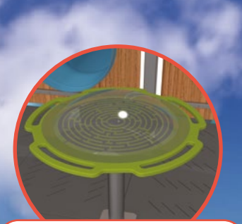
Jeu de labyrinthe avec bille